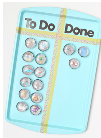
do it yourself MAGNETIC CHORE CHART www.seevanessacraft.com

1. Vizualni podsjetnik s magnetima. Na poklopac od staklenke se radnja može nacrtati ili zalijepiti fotografija. Fotografija može biti i od djeteta kako obavlja radnju. Na limeni pladanj se označi dva polja. Jedno je polje za zadatak koji nije obavljen, a kada se zadatak odradi poklopac se prebaci u polje za odrađene zadatke.